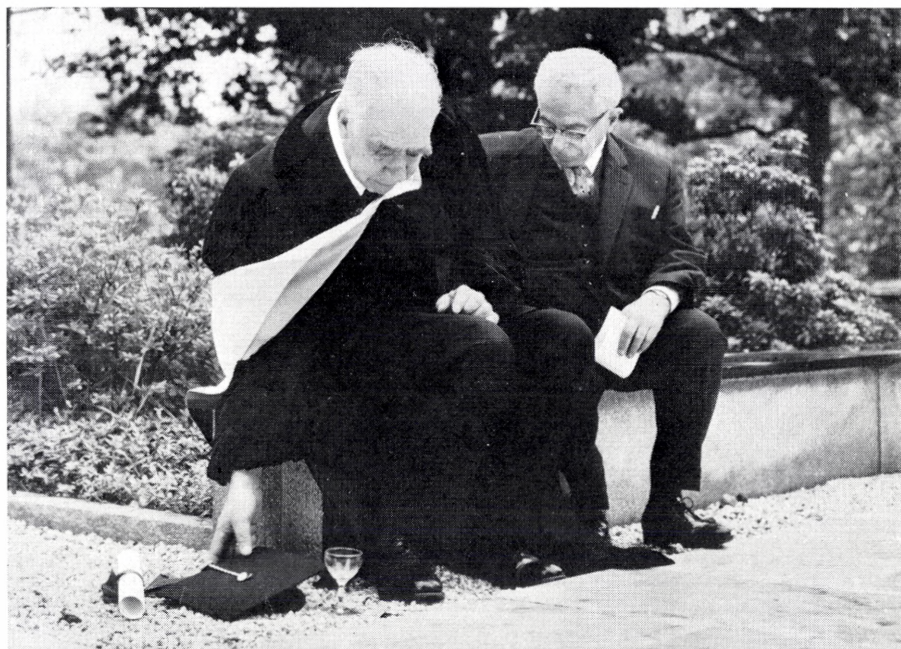
Efter promotionen til æresdoktor ved Rockefeller-Instituttet i New York i 1962. Niels Bohr sammen med matematikeren Richard Courant